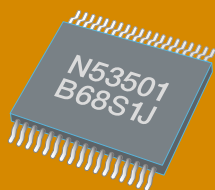
電子部品・半導体

半導体関連やリチウム電池の超低湿度製造ライン 精密機械の結露防止や環境試験室の結露防止