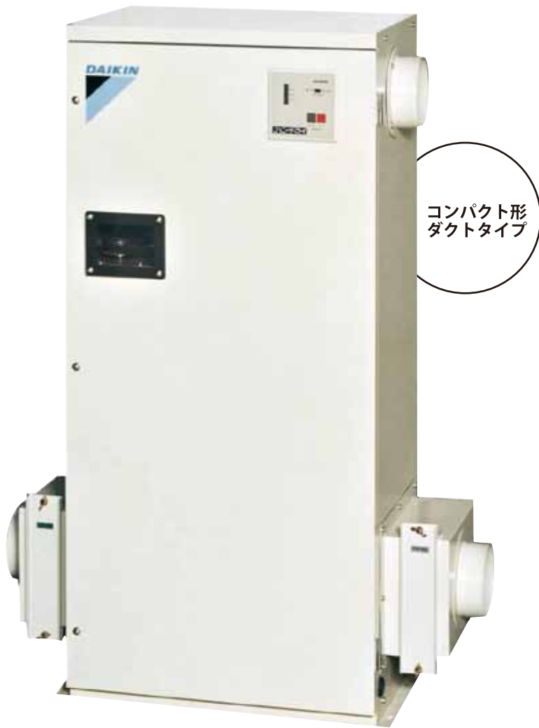
コンパクト形 ダクトタイプ